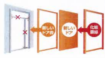
※増改築に伴って新設されるものでも可