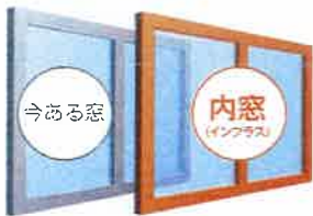
※内窓の交換でも可